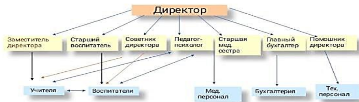
Рис. 2. Взаимосвязь структурных подразделений