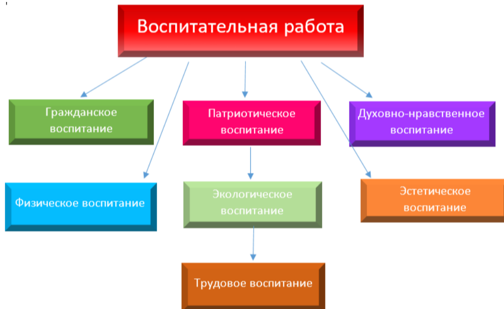
Рис. 1 Основные направления воспитательной деятельности

Воспитательный потенциал в нашей школе-интернате реализуется через: Уроки . В рамках модуля «Урочная деятельность» учителя включают в рабочие программы учебных предметов темы, соответствующие календарному плану воспитательной работы. Это значит, что каждый урок, помимо предметного содержания, несет в себе и воспитательный аспект.