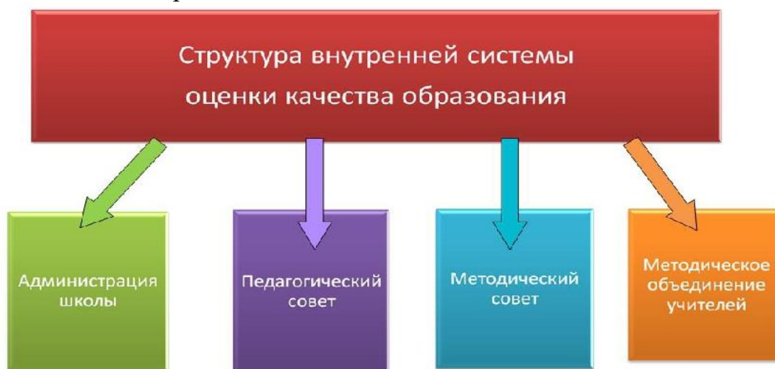
Рисунок 3. Организационная структура ВСОКО

Положение о внутренней системе оценки качества образования (далее – ВСОКО) определяет цели, задачи, принципы внутренней системы оценки качества образования в ГОСУДАРСТВЕННОМ КАЗЕННОМ ОБЩЕОБРАЗОВАТЕЛЬНОМ УЧРЕЖДЕНИИ «ЯСИНОВАТСКАЯ САНАТОРНАЯ ШКОЛА-ИНТЕРНАТ № 14», её организационную и функциональную структуру, реализацию (содержание процедур контроля и экспертной оценки качества образования) и общественное участие в оценке и контроле качества образования.