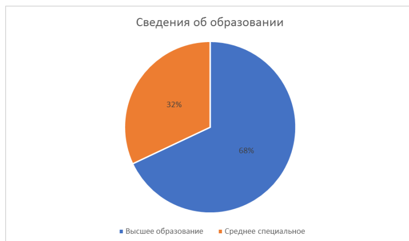
Диаграмма 2. Сведения об образовании

Целенаправленно ведется работа по освоению педагогами современных методик и технологий обучения. Большое внимание уделяется формированию у учащихся навыков творческой деятельности, развитию общеучебных навыков, сохранению и поддержанию здоровьесберегающей образовательной среды.